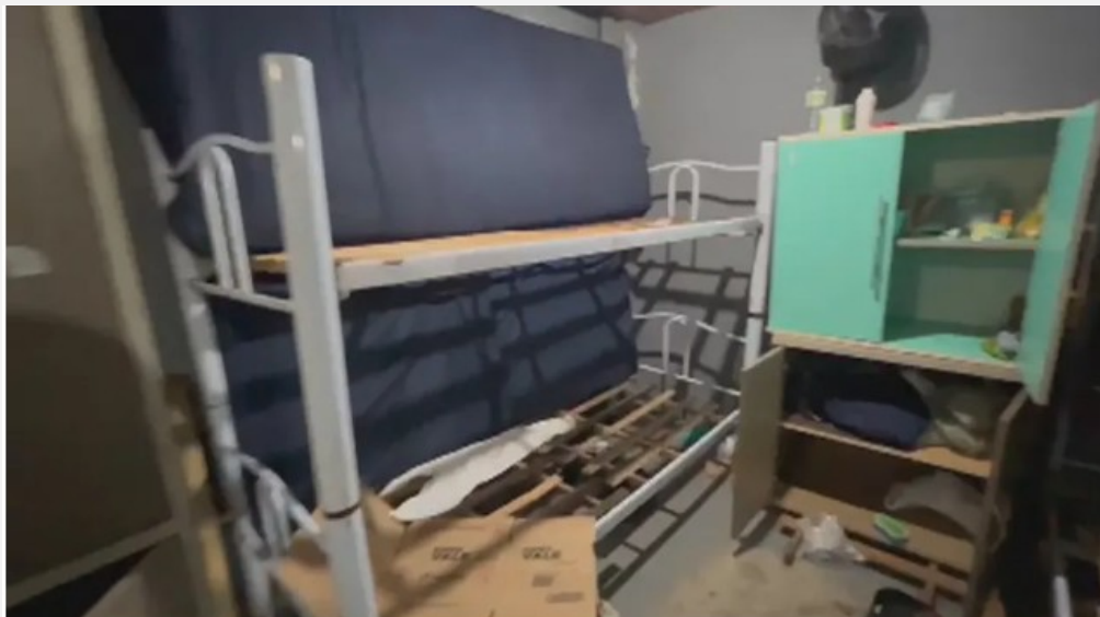
Alojamento onde trabalhadores foram resgatados em Bento Gonçalves

Em uma carta aberta divulgada na quinta-feira (2), a Vinícola Aurora – uma das três que usaram mão de obra análoga à escravidão durante a colheita da uva em Bento Gonçalves, na Serra do Rio Grande do Sul – pediu desculpas aos trabalhadores resgatados e se disse envergonhada.