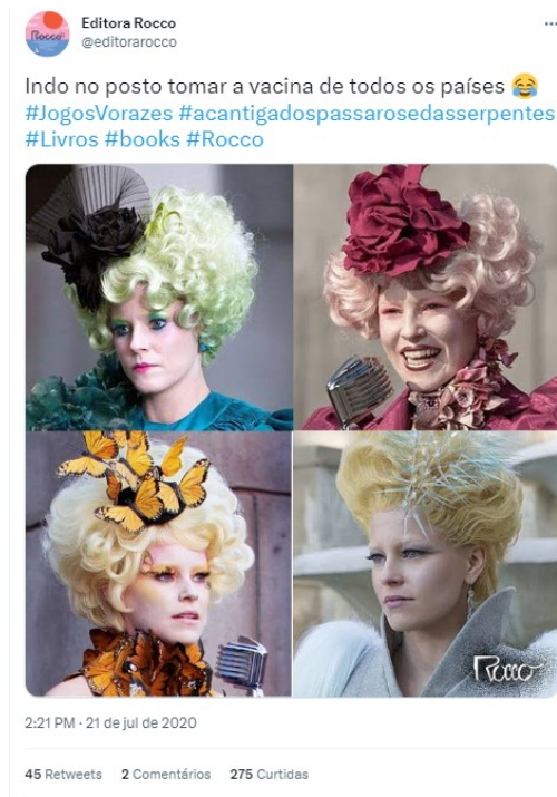
Figura 1: Vacinação.